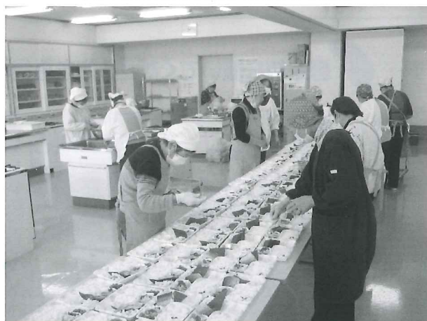
【ひとり暮らし高齢者見守り事業】

市内の高齢者に対して配食サービスによる安否確認と飲料水配布による夏の熱中症予防の呼び掛けに活用させていただきました。安心安全なまちづくりができました。ありがとうございました。