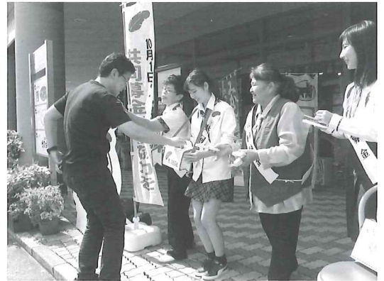
【ガールスカウトによる街頭募金】

共同募金会では、様々な福祉活動に対する助成金の申請を受け付け、それらの必要性・緊急性等を考慮して助成計画を作成しています。その計画を実現するための目標額として募金活動を行ないます。誰もが安心して暮らせる地域づくりのため、皆様のご理解・ご協力をお願い致します。