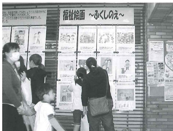
【福祉絵画啓発事業】

市内の小学生が、福祉というテーマで絵画を描くことで福祉を具体的に考えるきっかけとなりました。皆様の善意に感謝申し上げます。