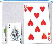
マンモストランプ