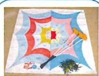
スパイダーボール

子ども会やいきいきサロン、行事のミニコーナーにレクリエーションはいかがでしょう。