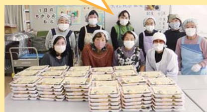
なかよし会の皆さん