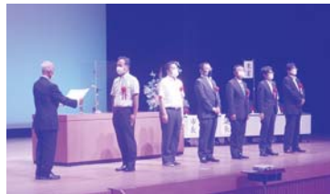
▲感謝状を授与された皆様