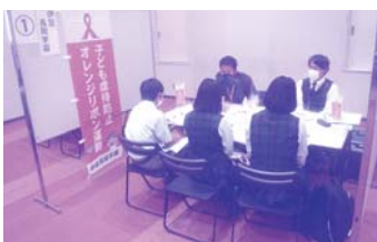
▲会場には高校生の姿もありました