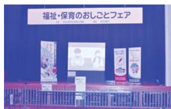
▲動画で参加法人の紹介も行いました

社会福祉大会と同日、6月25日に「福祉・保育のおしごとフェア」をアクセスかつらぎ多目的ホールで開催しました。福祉人材の確保を目的に、伊豆の国市社会福祉法人連絡会参画法人など12社が出展。参加者は、各法人の採用担当者から施設紹介や業務内容の説明を受けました。 また会場では市内施設の職員インタビュー動画「福祉の仕事にエールを！」も上映されました。