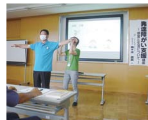
《発達障がい支援講座》