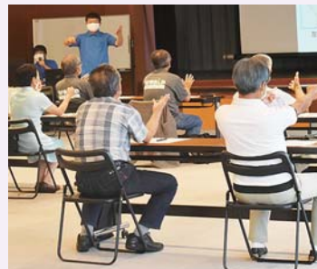
昨年度 脳トレの様子