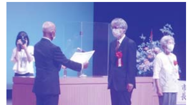
▲社会福祉事業協力者の皆様