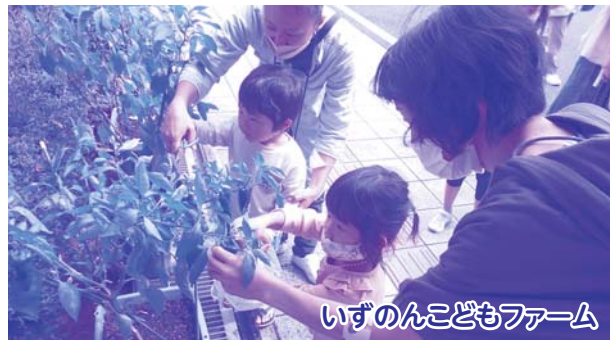
いずのんこどもファーム

自治会や各種団体と連携し地域の課題に向けた取組みや誰もが気軽に参加できるボランティア養成講座や体験事業、居場所事業の実施、コロナ禍で停滞しているボランティア活動や地域における困りごとへの活動支援の実施。