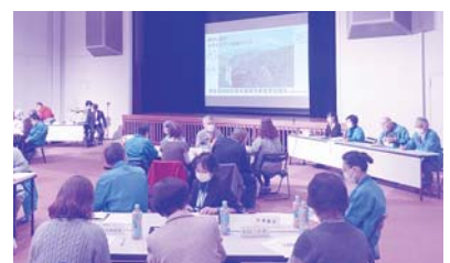
市内全民生委員が集まった研修の様子