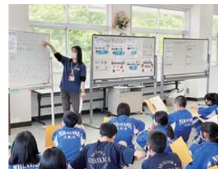
《韮山中学校 福祉教育》