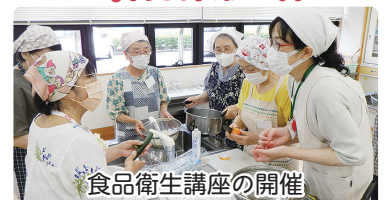
食品衛生講座の開催