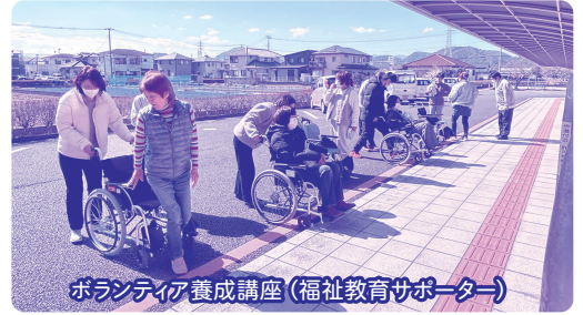
ボランティア養成講座(福祉教育サポーター)