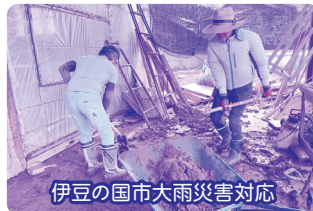
伊豆の国市大雨災害対応