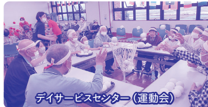
デイサービスセンター(運動会)