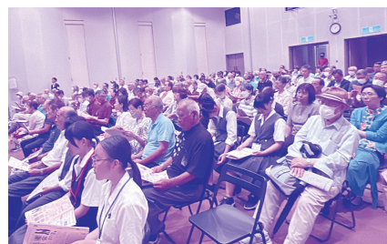
多くのご来場をいただき会場はいっぱいとなりました