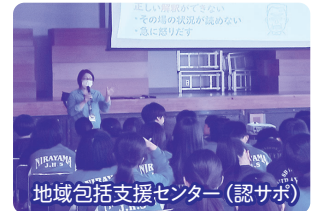
地域包括支援センター(認サポ)