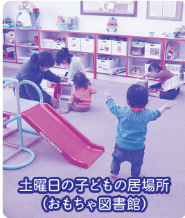
土曜日の子どもの居場所(おもちゃ図書館)