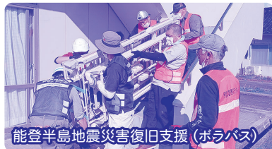
能登半島地震災害復旧支援(ボラバス)