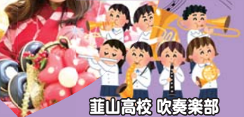
韮山高校 吹奏楽部