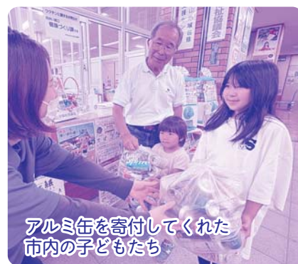
アルミ缶を寄付してくれた市内の子どもたち