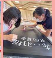
~R6年度街頭募金の様子~