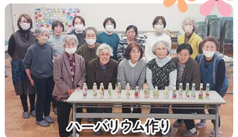
ハーバリウム作り