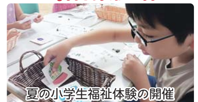
夏の小学生福祉体験の開催