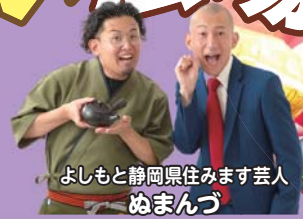
よしもと静岡県住みます芸人 ぬまんづ