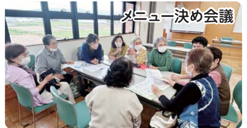
メニュー決め会議