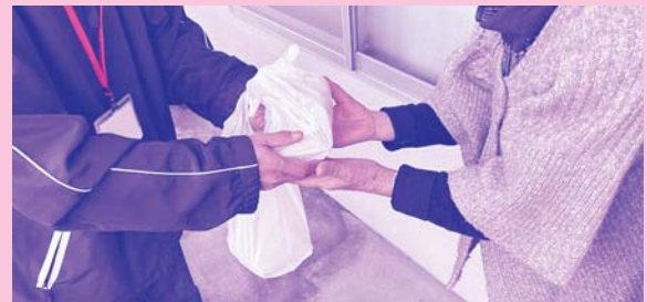
▲民生委員による見守り訪問や見舞品配布

住み慣れた自宅で安心して生活をしていくために、民生委員による訪問活動などを通じて、地域で見守る活動を行っています。