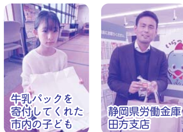
牛乳パックを 寄付してくれた 市内の子ども