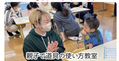
親子で道具の使い方教室