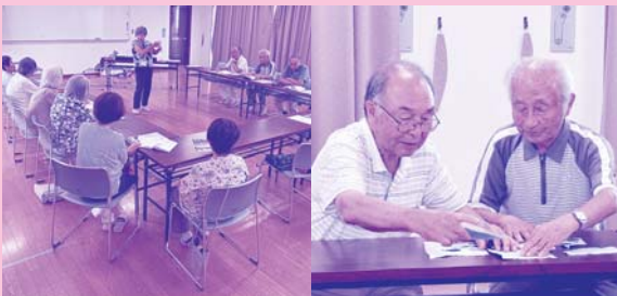
▲いきいきサロン中島 活動の様子

サロンやこども食堂、居場所づくりや福祉の啓発などを行っています。新しく居場所を立ち上げたい方や興味のある方は、お気軽にご相談ください！