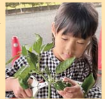
令和7年度活動の様子