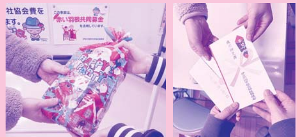
▲(左)子育て世帯への菓子配布(右)見舞金贈呈

非課税世帯を対象に、年末を少しでも安心して過ごしていただけるように見舞金やおもちゃ券などをお渡ししています。