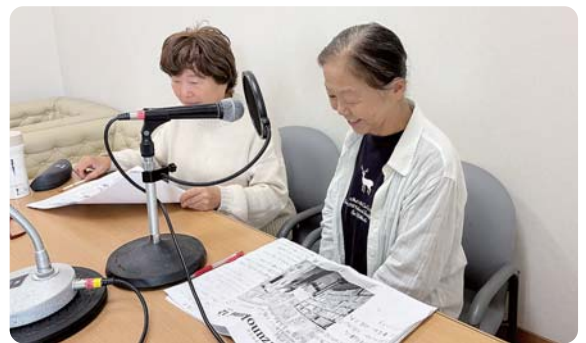
▲広報誌を音読している“声”のボランティア会員

活動内容 目の不自由な方や日本語を勉強したい外国籍の方等に向けて、広報誌を読み上げCDにしてお届けしています。「文字を読むのが大変」「音声で聞きたい」方はどうぞお気軽にご連絡ください。ご本人はもちろん、ご家族やお知り合いの方からのお問合せも大歓迎です。