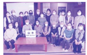
民生委員さんがスタッフとして活躍されるサロンの様子