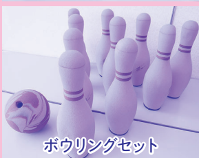
ボウリングセット