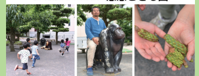
社会福祉法人 護汝会 慈恩こども園

社会福祉法人は、社会福祉事業を行うことを目的として社会福祉法にもとづいて設立されている法人です。高齢者、子ども、障害者、生活困窮者など、さまざまな生活課題や福祉ニーズをもつ方がたの生活を支援しています。(全社協HPから一部抜粋)