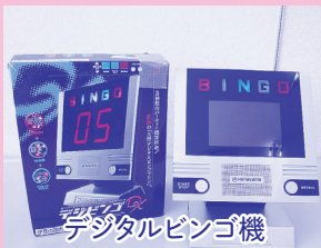
デジタルビンゴ機