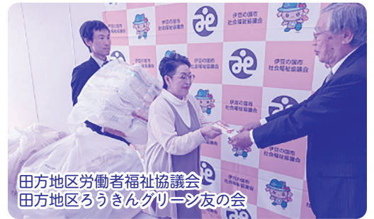
田方地区労働者福祉協議会 田方地区ろうきんグリーン友の会