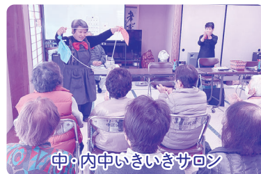
中・内中いきいきサロン