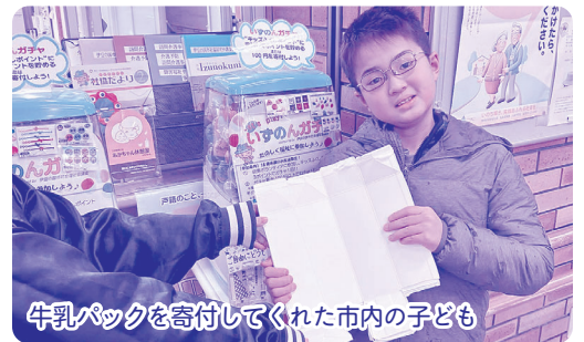
牛乳パックを寄付してくれた市内の子ども