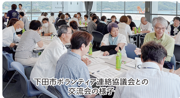
下田市ボランティア連絡協議会との交流会の様子

伊豆の国市では、様々なボランティア団体が地域を支える活動を行っています。こうした団体が情報交換をしながら学び合い、切磋琢磨することを目的に設立されたのが、伊豆の国市ボランティア連絡会です。連絡会では日々の活動で生まれる課題や工夫を共有し、相談や情報交換、交流会を通して団体同士の連携強化と活動の充実を図っています。