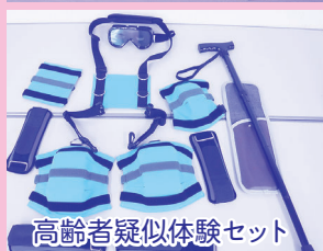
高齢者疑似体験セット