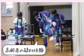
高齢者の疑似体験