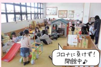
コロナに負けず! 開館中♪