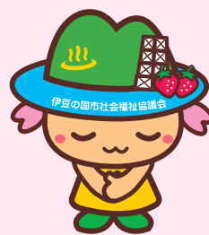
市民ボランティアのつどい

お問い合わせ・申込み 伊豆の国市社会福祉協議会・日赤伊豆の国市地区事務局 ☎055-949-5818 伊豆の国市四日町302-1 韮山福祉・保健センター