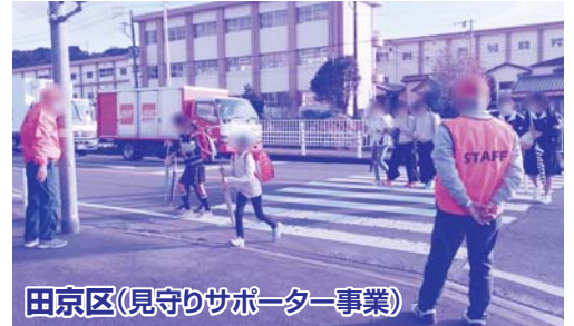
田京区(見守りサポーター事業)

●助成額 上限50,000円(予算の範囲内での交付となります) ※申請受付は5～9月を予定