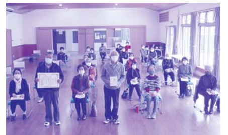
三福いきいきサロン様