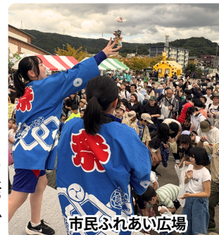
市民ふれあい広場