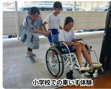
小学校での車いす体験