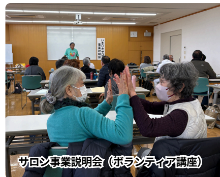
サロン事業説明会（ボランティア講座）