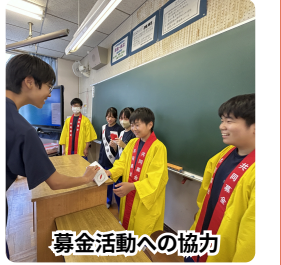
募金活動への協力