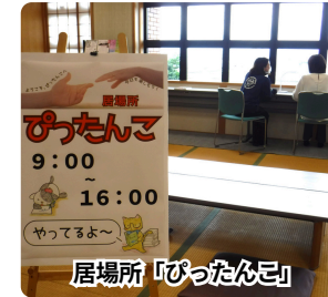
居場所「ぴったんこ」