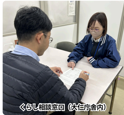
くらし相談窓口（大井町管内）