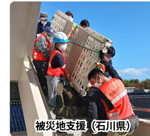
被災地支援（石川県）